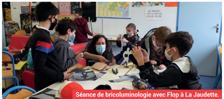
Séance de bricoluminologie avec Flop à La Jaudette.

Le THV affirme sa volonté d'ouvrir la culture au plus grand nombre. Avec, entre autres, sa programmation riche et diversifiée, son offre grandissante en faveur du jeune public et ses propositions artistiques originales et audacieuses, dans et hors les murs, il contribue grandement au dynamisme de la commune et participe au rayonnement culturel sur tout le territoire et bien au-delà.