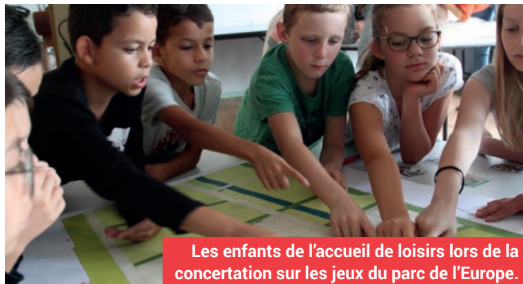
Les enfants de l'accueil de loisirs lors de la concertation sur les jeux du parc de l'Europe.

La concertation et la co-construction sont des thématique chères à la municipalité. Elles sont déclinées pour tous les publics, y compris pour les publics les plus jeunes. Il est essentiel de les associer : ils sont les adultes et citoyens de demain mais aussi les enfants d'aujourd'hui, dont le regard sur notre commune compte tout autant. C'est pourquoi des instances ont été mises en place pour faciliter cette construction commune.