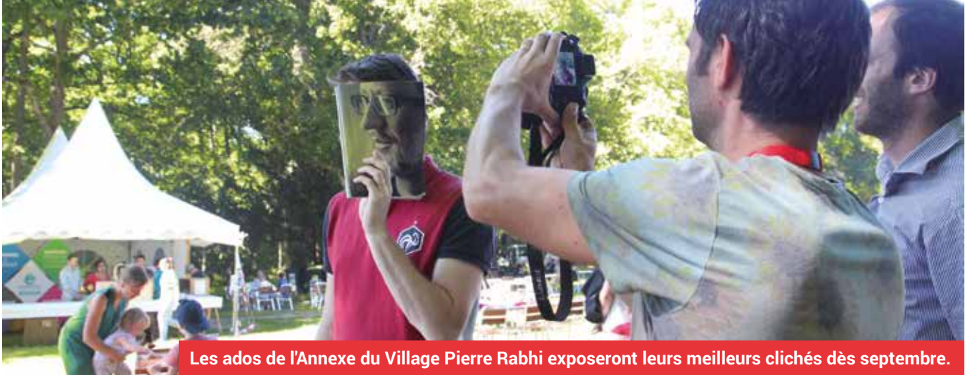
Les ados de l'Annexe du Village Pierre Rabhi exposeront leurs meilleurs clichés dès septembre.

“ Le bookface consiste à placer un livre devant soi pour qu'il se fonde avec la réalité. ”