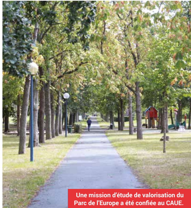
Une mission d'étude de valorisation du Parc de l'Europe a été confiée au CAUE.

Afin de mieux définir les attentes des usagers, le CAUE organisera à partir du mois de septembre une série de rencontres auprès de différents acteurs : riverains, Conseillers Participatifs de Secteurs (CPS), gestionnaires d'équipements du parc (ESAIP, Maison de l'Enfance, Résidence Bon Air...) et services municipaux. La synthèse de ces entretiens permettra de définir les orientations d'aménagement et de mise en valeur du site. Un groupe de pilotage mis en place par la municipalité assurera le suivi de la démarche en associant les différents partenaires et acteurs concernés sur les différentes étapes du projet. La restitution finale est prévue en novembre. Pour tout renseignement, merci de contacter la ville : ville-stbarth@ville-stbarth.fr ■